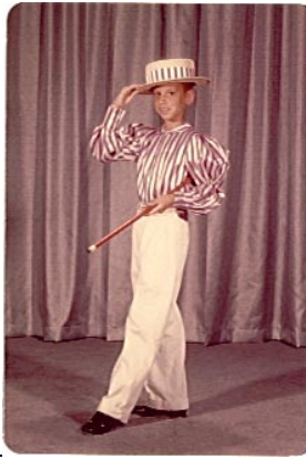
Chef de Quiseen MissSewer Aqua