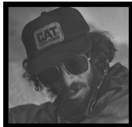
Le Slob deClasse de Busboy MissSewer Helms